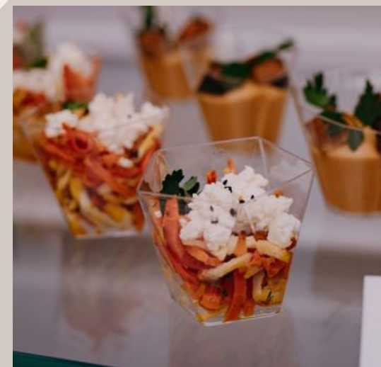
Sałátka z pieczonych warzyw z wędzonym twarogiem