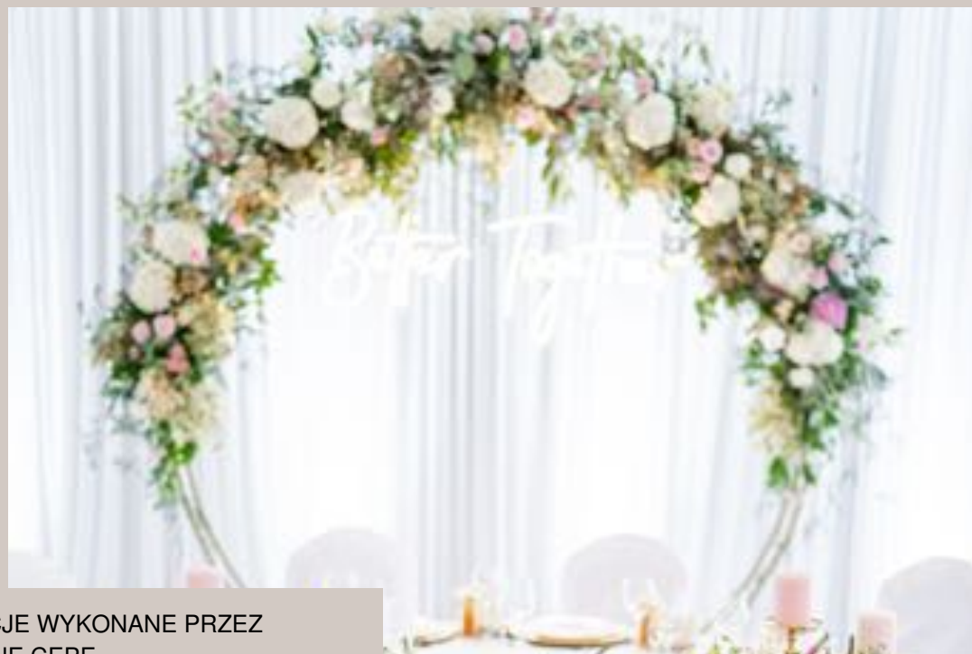
PRZYKŁADOWE DEKORACJE WYKONANE PRZEZ KATARZYŃĘ CEPEŃ & ZESPÓŁ Z GALERII KWIATÓW ZUZA