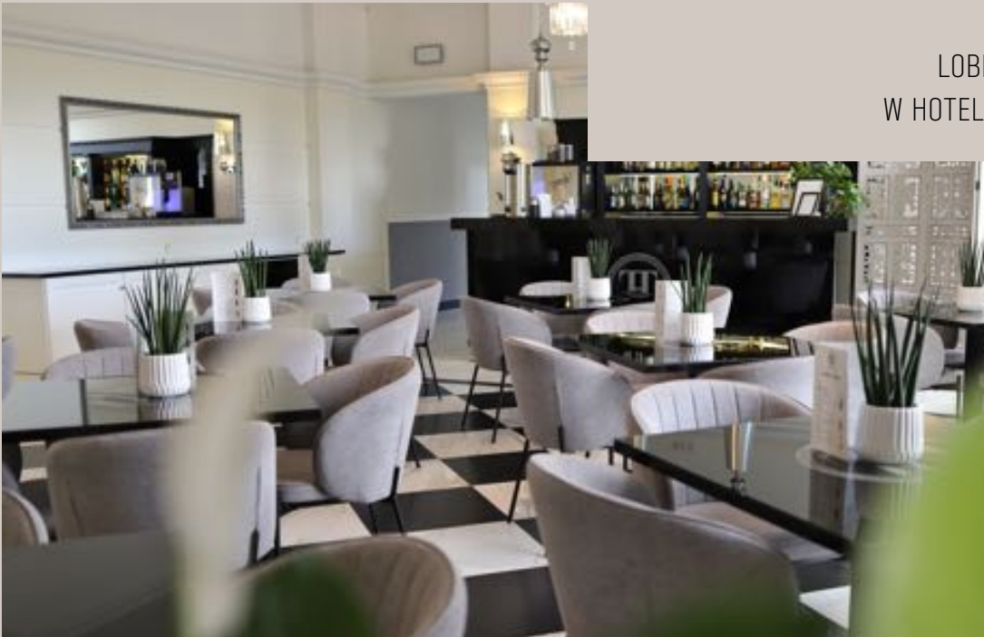
LOBBY BAR W HOTELE TOSCANIA