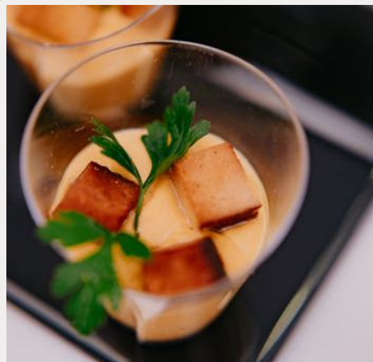
Hummus z ciecierzycy z wędzonym twarogiem