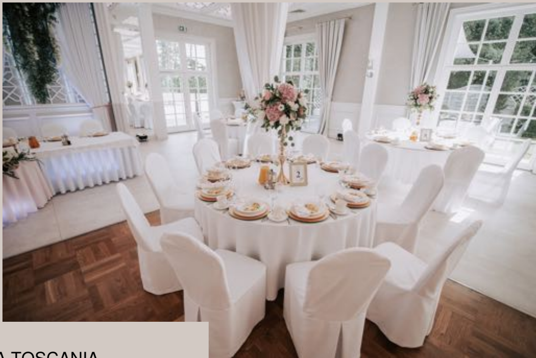
SALA BALOWA TOSCANIA