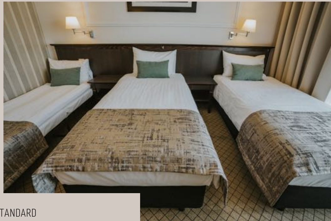
POKÓJ STANDARD W HOTELU TOSCANIA