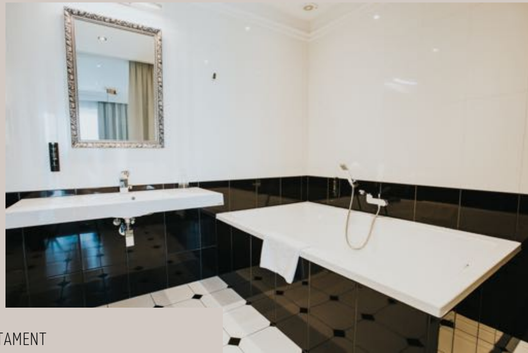
APARTAMENT W HOTELU TOSCANIA