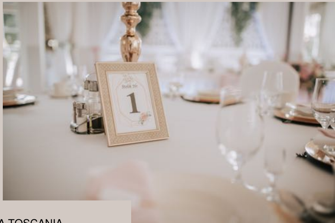
SALA BALOWA TOSCANIA