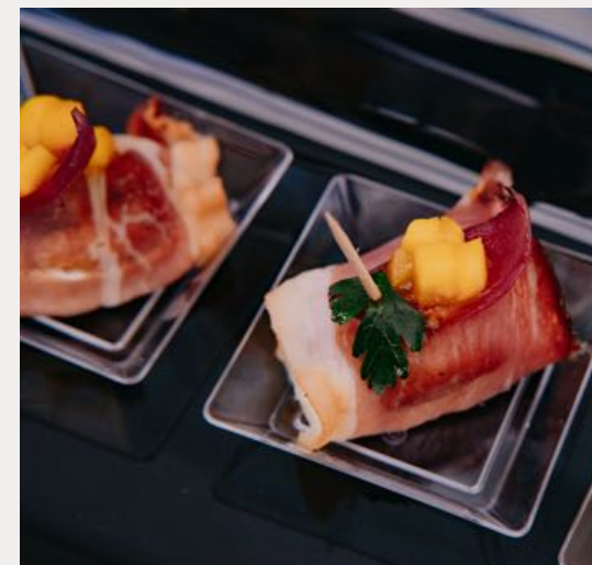
Kozi ser z figą w szynce szwarcwaldzkiej